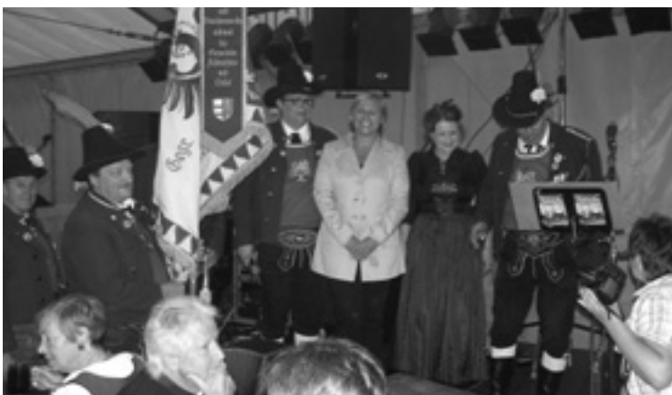
▲ Předání slavnostní stuhu střelcům.