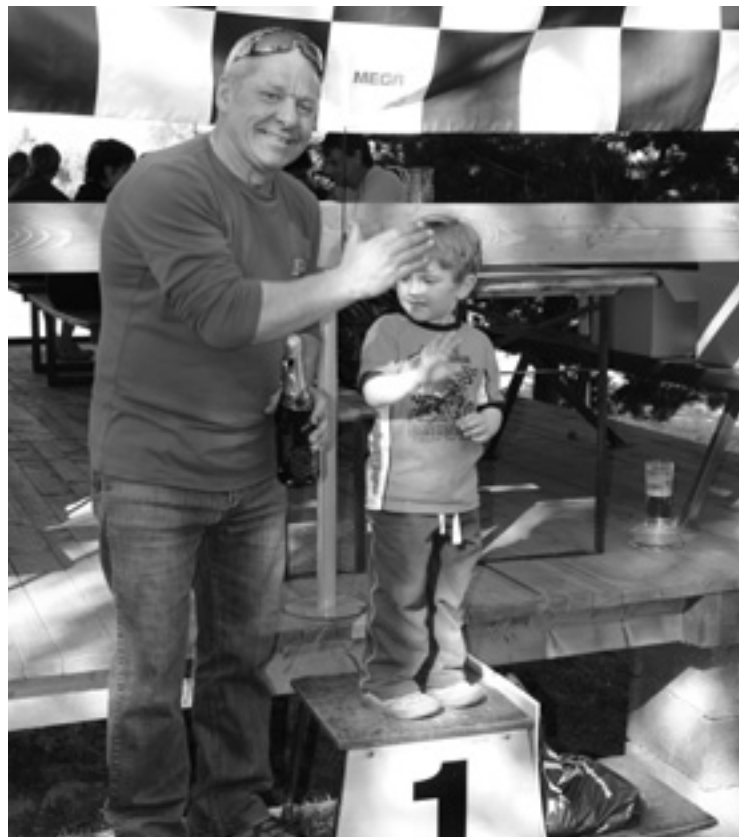
▲ Nejmladší a nejstarší účastník závodů.