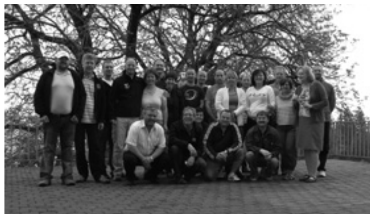
▲ Delegace Albrechtic s majitelkou penzionu.