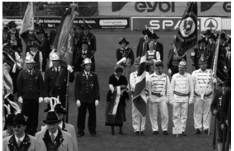
▲ Sraz střeleckých kompanií a albrechtičtí hasiči.