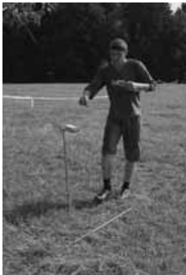
Závody v OB (Vítězslav Khýn)