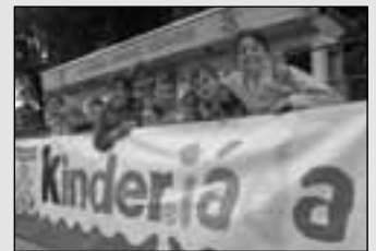
Konec školního roku v ZŠ Albrechtice