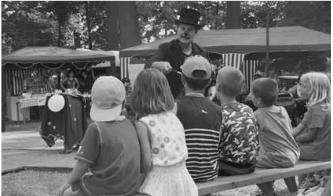
Letní slavnosti - představení pro děti