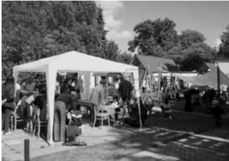
Den dětí v základní škole

(přeloženo z městského magazínu Wörgl – červenec)