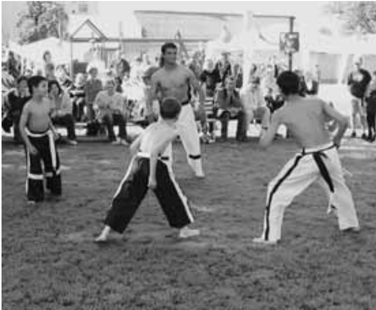
Den dětí v základní škole