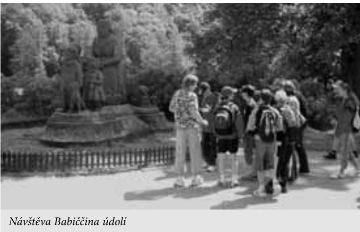
Návštěva Babiččina údolí