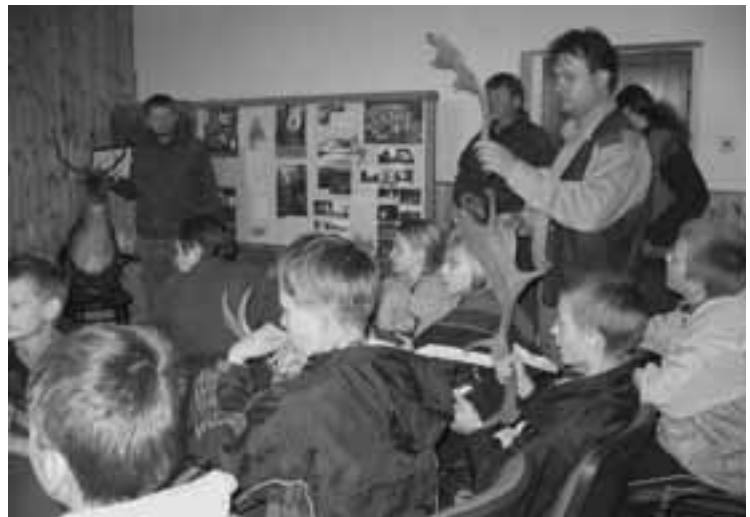
Žáci 4. a 5. ročníku na návštěvě v Lesním družstvu Vysoké Chvojno