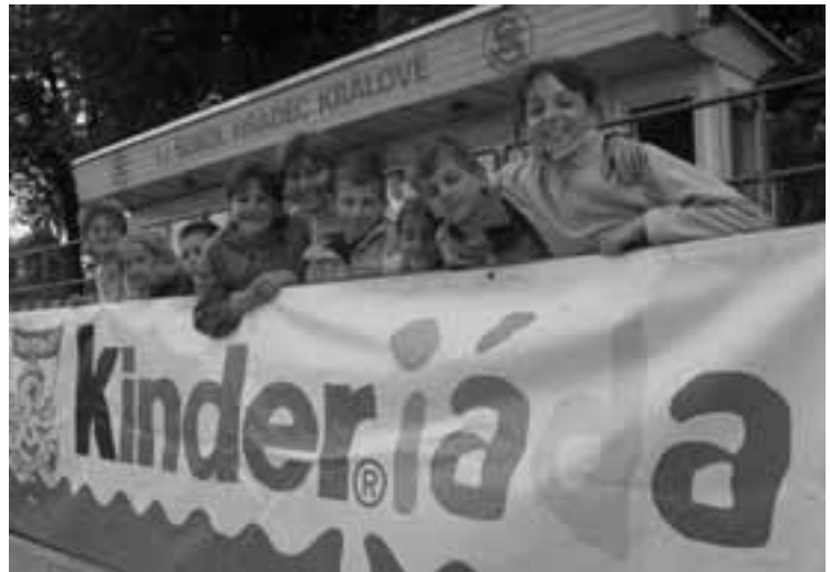
Poprvé na Kinderiádě v Hradci Králové

Budova školy si však ani letos neoddychla. Už léta trápí naše zařízení nedostatek míst v mateřské škole.