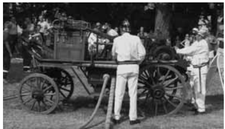
Historická hasičská stříkačka Smekal z roku 1925 (plně funkční)