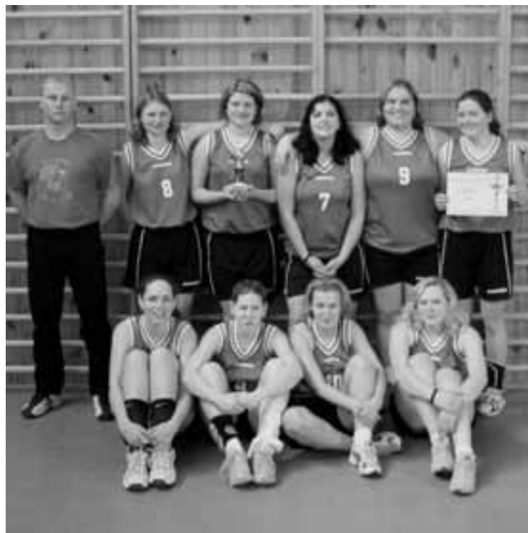
Oddíl volejbalu Albrechtice nad Orlicí - ženy