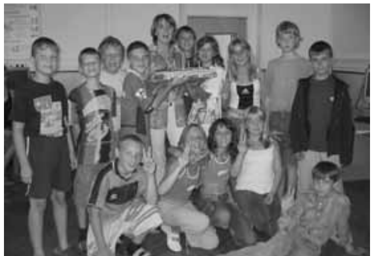
Loučení s pátáky

Vzhledem k tomu, že budova MŠ je malá a žádné prostory v ní již nelze využít, zvolili jsme jiný způsob řešení. MŠ využije jednu třídu základní školy. A tak se o prázdninách běžná třída ZŠ proměnila v útulnou třídu MŠ. Zároveň proběhlo i malování v mateřské škole a školní kuchyni.