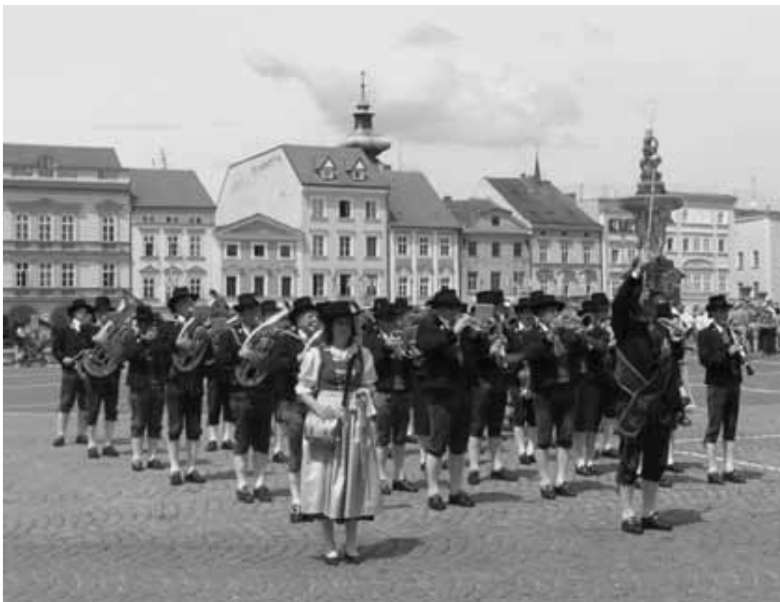
Slavnostní nástup dechové hudby z Wörglu na opočenském náměstí

Celá akce proběhla ke všeobecné spokojenosti jak pořadatelů, tak i účastníků festivalu. Jaromír Kratěna