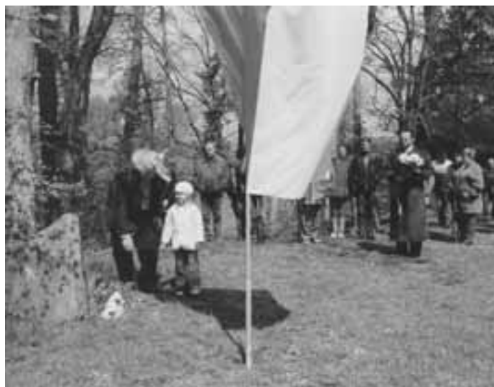
Pokládání kytic k pamětní desce padlých letců