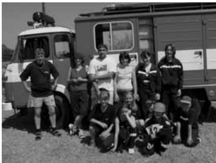
Družstvo SDH Albrechtice nad Orlicí

3. září se družstvo mužů SDH Albrechtice zúčastnilo soutěže v požárním sportu v Kosteckých Horkách, kde se umístili na 8. místě.