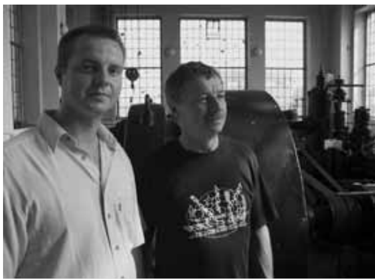
Noví majitelé albrechtické elektrárny