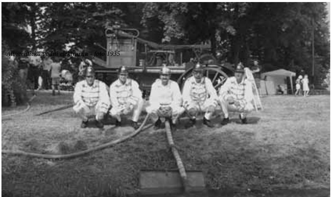
Albrechtická vodní elektrárna - foto 1935