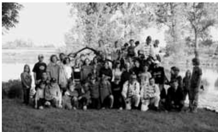
Společná fotografie albrechtických hasičů s dětmi a učiteli z Wörglu