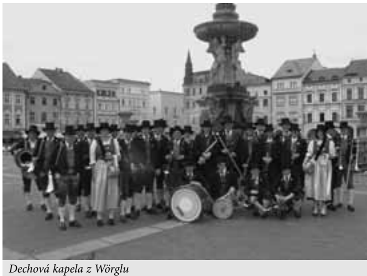
Dechová kapela z Wörglu