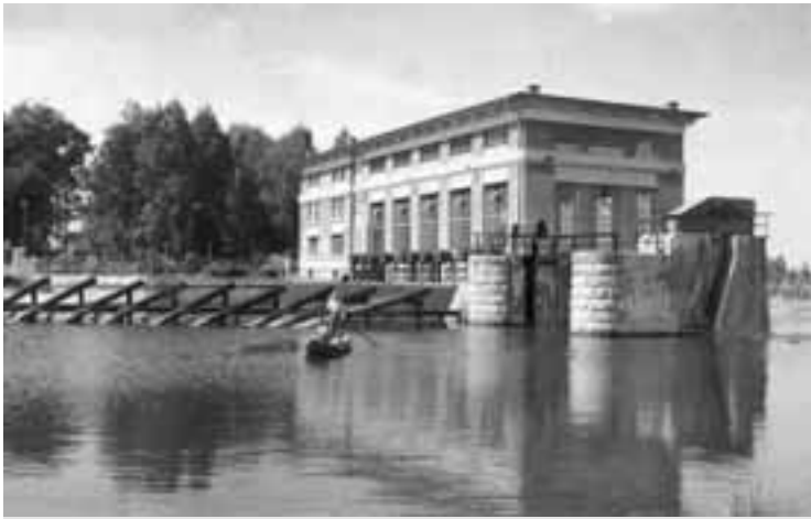
Albrechtická vodní elektrárna - foto 1935

V srpnu letošního roku oslavila albrechtická vodní elektrárna již 80. výročí od zahájení provozu. K této příležitosti se konala v sobotu 20. srpna v areálu elektrárny malá společenská akce spojená se dnem otevřených dveří. Využil jsem této příležitosti a požádal jsem nového majitele elektrárny o krátký rozhovor.