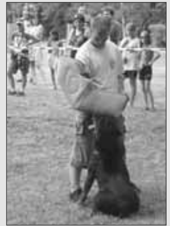
Albrechtické letní slavnosti 2005 ... Naposled!?