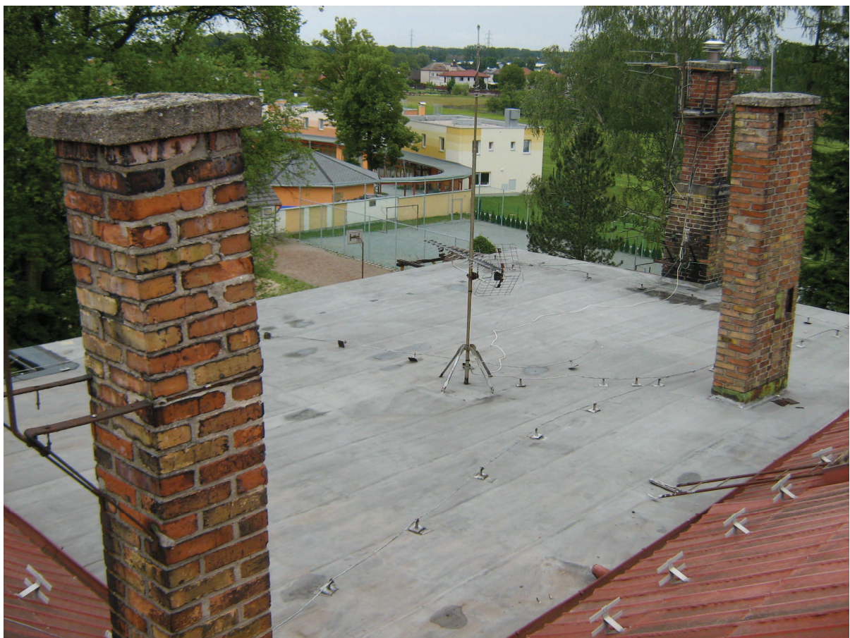
Celkový pohled na střechu nad učebnou výpočetní techniky.