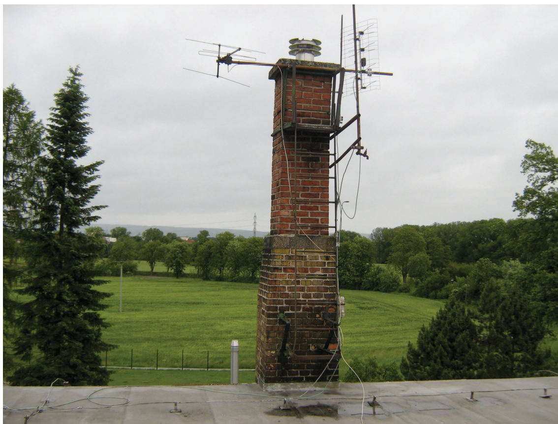
Funkční komín – oprava spár, omítnutí, oplechování vrchu komínu.