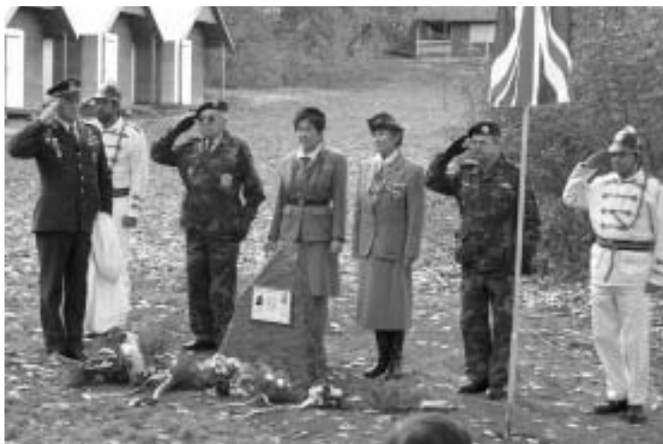
Odhalení pamětního kamene letcům z druhé světové války.