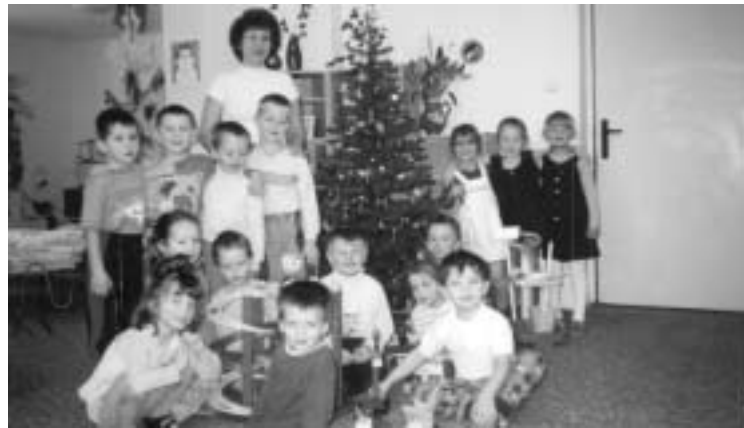
MŠ u nazdobeného vánočního stromčku.