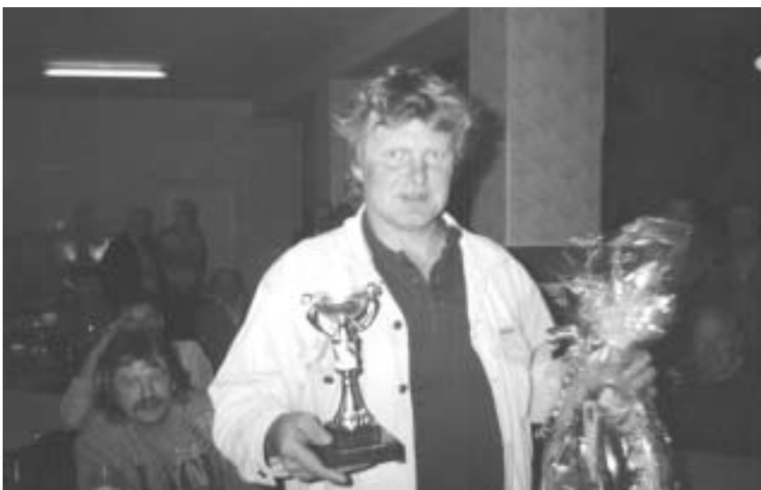
... vítěz turnaje ...