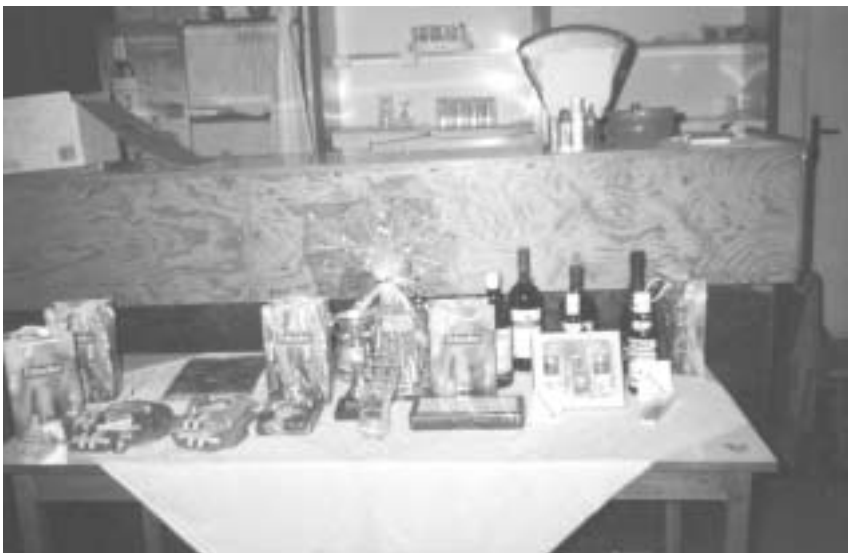
Ceny pro vítěze.