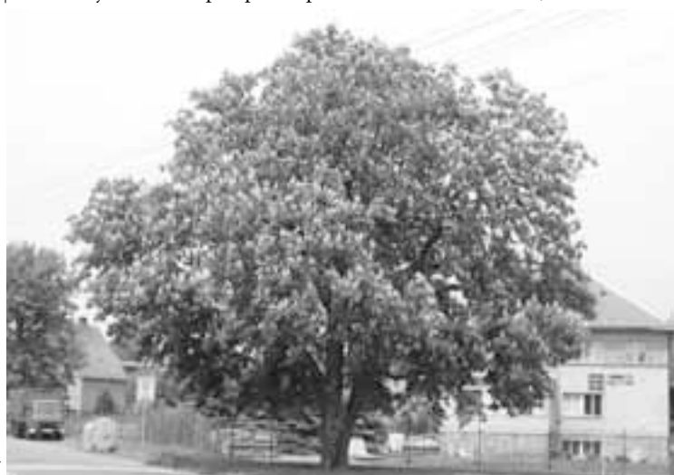
... kaštan v ulici 1. máje