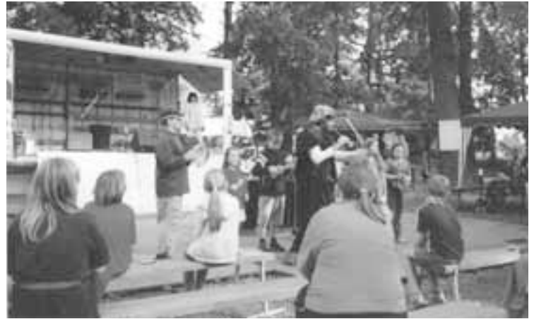
Letní slavnosti - představení pro děti.

Při přípravě letošních slavností jsme využili zkušeností z loňského roku. Odměnou za naši práci a vlo-