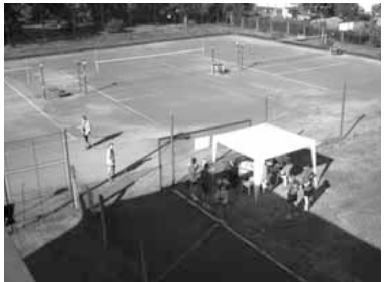
Volejbalový turnaj v Albrechticích nad Orlicí.