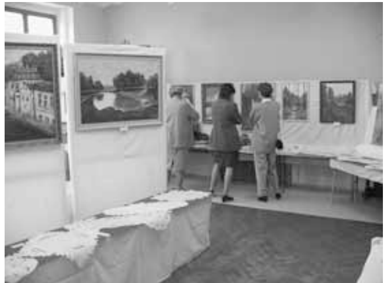
Výstava lidové tvořivosti v základní škole.