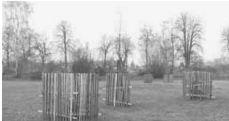
Stromy vysazené v parku u elektrárny.