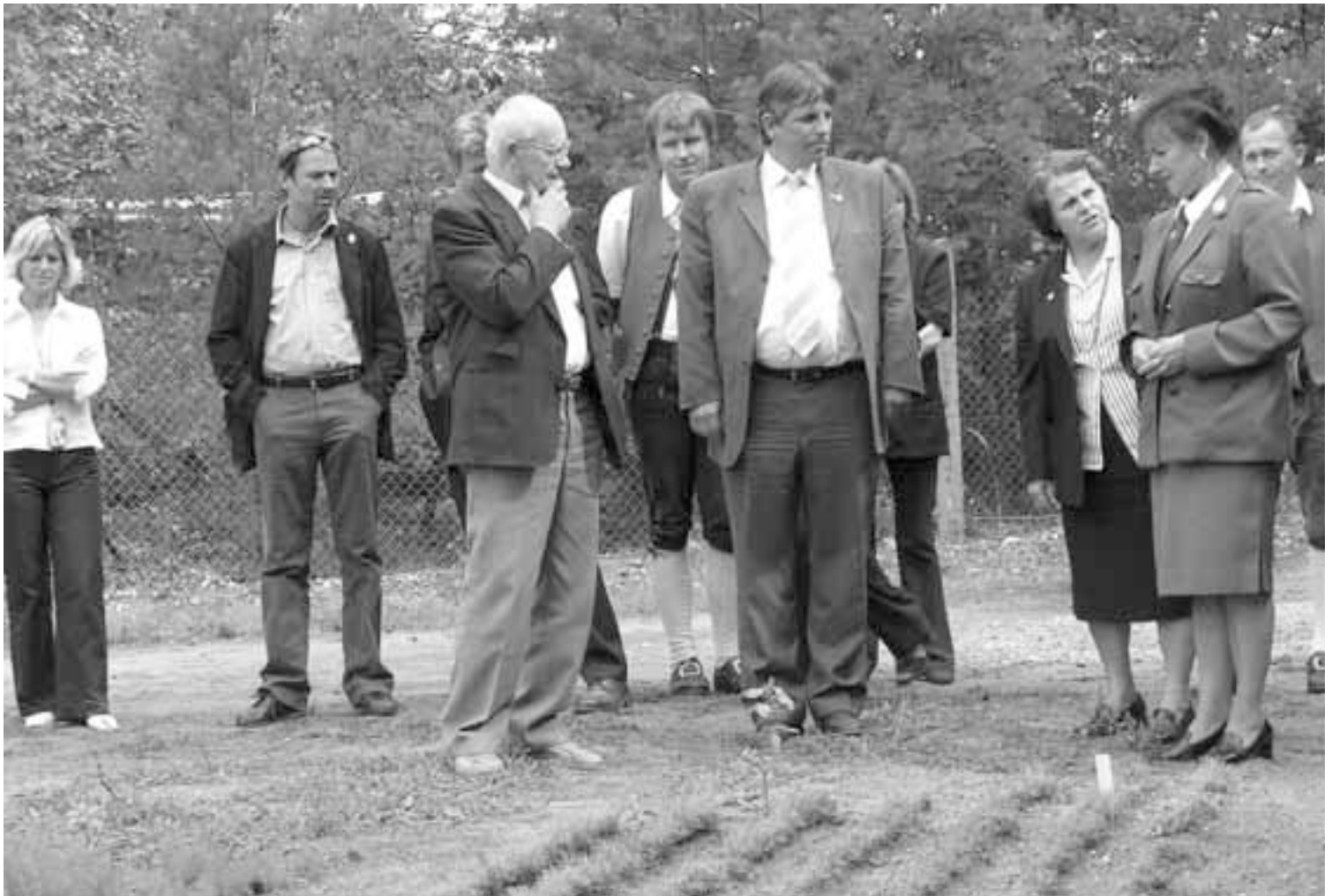
Delegace z Wörglu při návštěvě lesoškolek.