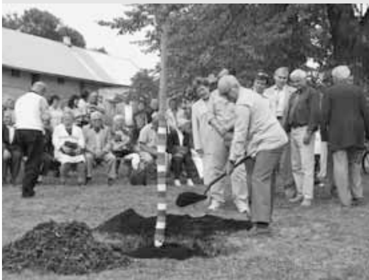
Zasazení památné lípy Na Návsi.