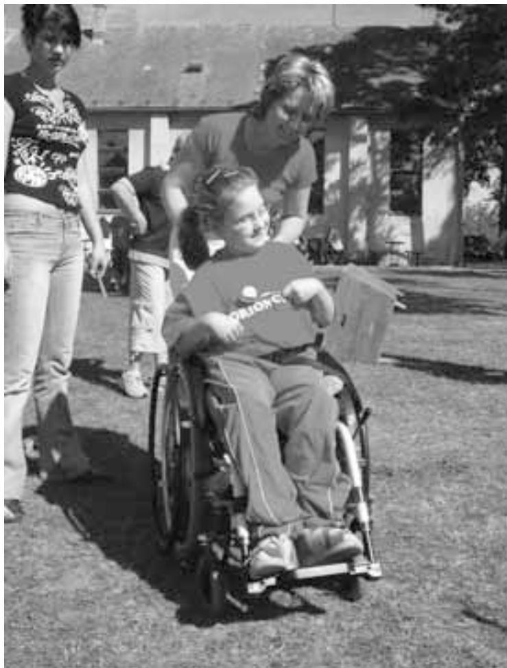
Sportovní den Orionu na sokolském hřišti.