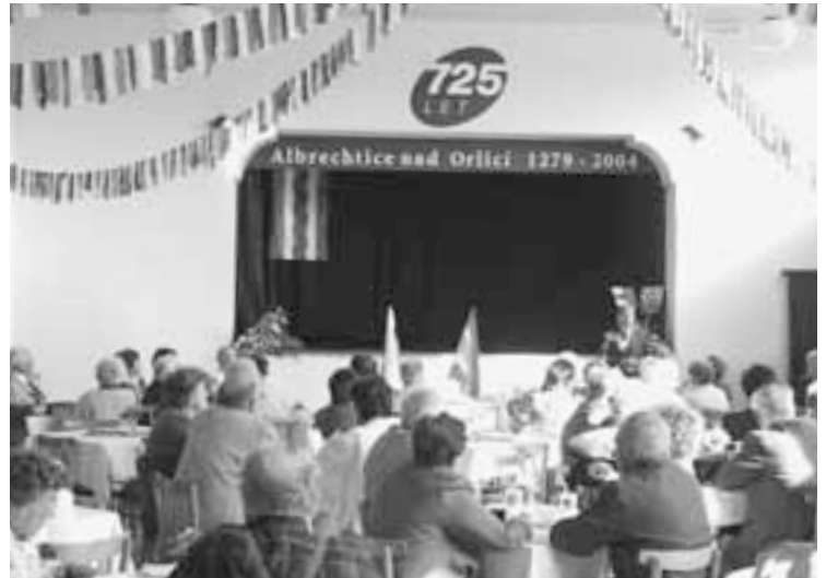
Setkání rodáků obce v restauraci Na Drahách.