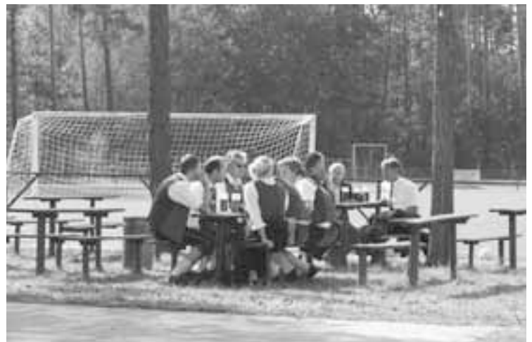
Delegace z Wörglu při návštěvě sportovního areálu v Borku.