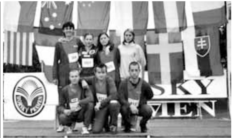
Oddíl orientačního běhu Albrechtice nad Orlicí.

V sobotu proběhla třetí a čtvrtá etapa. Start třetí etapy byl v devět hodin. Trať byla zkrácená se startem 2 km od shromáždění. Počasí bylo opět nádherné. Mapa byla Venušiny misky-jih v měřítku 1 : 7 500 s krásným terémem severského typu. Odpoledne byla na pořadu čtvrtá etapa - sprint. Tratě byly připraveny přímo z centra závodu na mapě Venušiny misky - sever 1 : 4 000. V divácky zajímavém závodě rozhodovaly o pořadí sekundy. Tratě byly v průměru dlouhé 2 km a tak se časy pohybovaly od 15 do 20 minut. Večer opět proběhlo vyhlášení nejlepších závodníků a byly rozděleny startovní časy na nedělní handicapový start do poslední etapy.