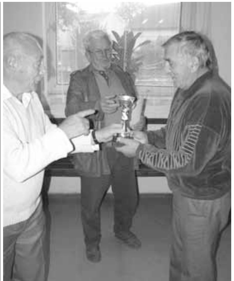
Předání poháru vítězi turnaje.