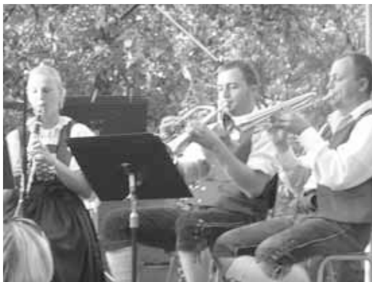
Výběr dechového orchestru z Wörglu.