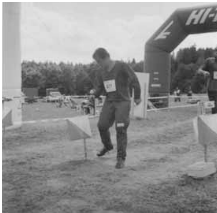
Orientační běh - závody