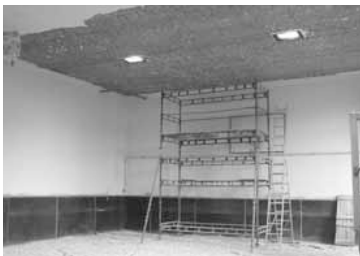
Sluka P. Oprava tělocvičny