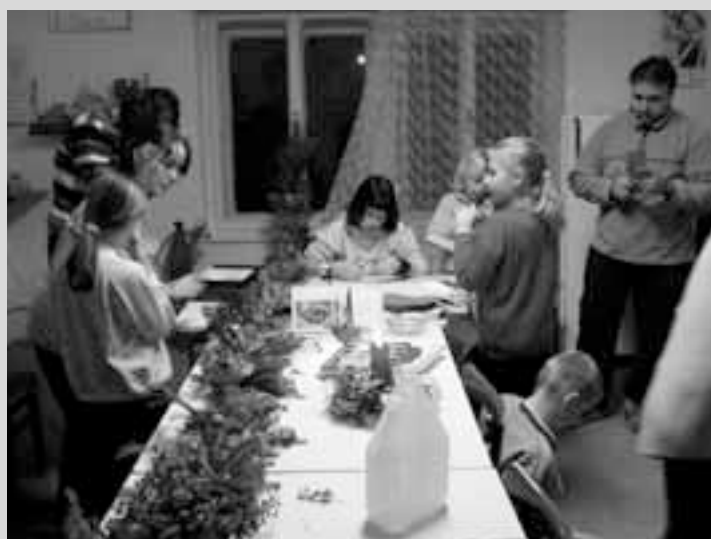
Mladí hasiči připravují výzdobu hasičské zbrojnice.