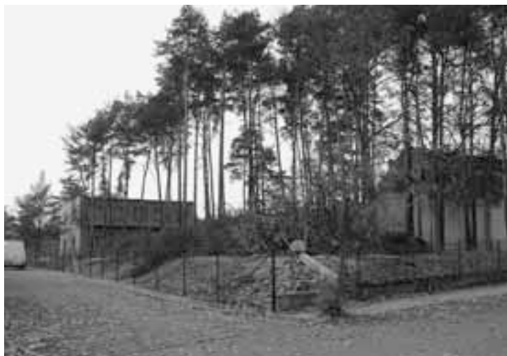
Prořízka stromů u sokolovny